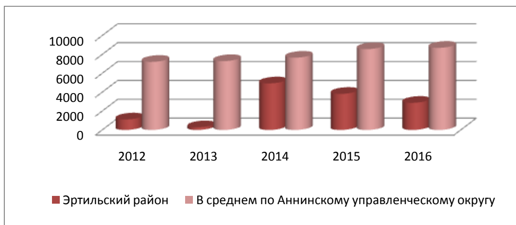
Рисунок 1.2 – Ввод в действие жилых домов за счет всех источников финансирования, кв. м

руб. (122,4%), муниципального бюджета -70,0 тыс.руб. Построена газовая блочно-модульная котельная в п. Первомайский для Первомайской СОШ с объемом финансирования в сумме 11267,0тыс.руб., проведены работы по ремонту канализации в СОШ с углубленным изучением отдельных предметов с объёмом финансирования 60,0тыс. руб. и на прочие мероприятия израсходовано 40,0 тыс. руб. (проведение семинара с участием специалистов торгово-промышленной палаты) По коммерческой части в 2016 году планировалось начало реализации 1 инвестиционного проекта, предусмотренного Программой. Проект предполагал начало строительства в с. Б.Самовец молочного комплекса на 24000 голов КРС. Начало реализации мероприятия перенесено на 2017г. по причине недостаточности средств в ЗАО «СХП ВИКТОРИЯ». В финансировании коммерческого проекта планируется использовать как собственные средства предприятия, так и заемные.